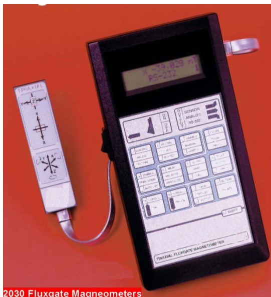
2030 Fluxgate Magnetometers